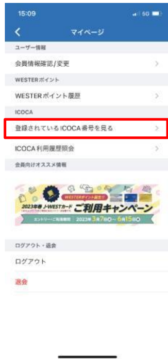
「登録されているICOCA番号を見る」をタップ