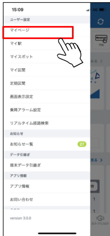
マイページをタップ