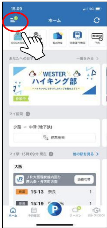
メニューをタップ